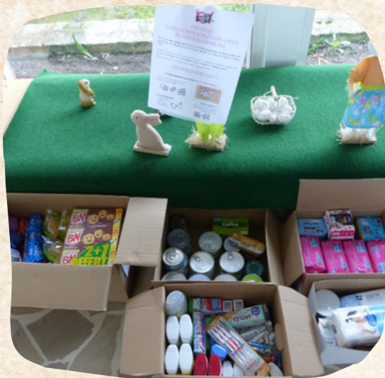
Une jolie collecte pour les Restos du cœur !

Les Restos du cœur proposent une aide alimentaire. Ils peuvent accompagner les gens dans leurs démarches pour trouver un logement. Ils nous aident aussi à partir en vacances, à participer à des activités et des sorties.