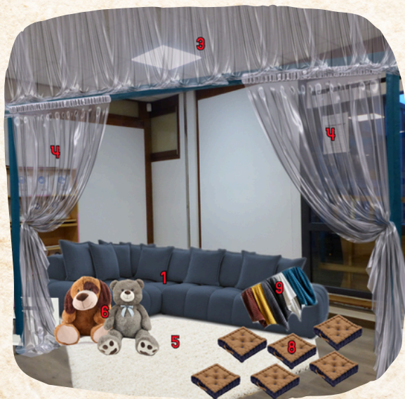
Simulation du projet d'espace "Comme à la maison" au CDI

Pour cela, ce sont les élèves eux-mêmes qui ont fait des propositions. Et cela a été voté lors d'une réunion du FSE avec les élèves délégués. On trouvera donc un canapé, des peluches et des tapis. Cela va coûter en tout près de 3 000€, un sacré montant !