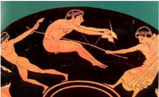
Le saut en longueur